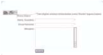
Macintosh'ta Explorer 4.5 ile görüntülenen bir form sayfası. Form içindeki yazı alanlarının genişliğine ve 'Gönder' butonunun şekline dikkat ediniz.

"Kolayı varken neden zahmetlisini öğrenelim?" diyebilirsiniz. Ancak, elinizde Charoma Converter gibi bir yardımcı olmadığı durumlarda da alternatif bir çözüme ihtiyaç duyabilirsiniz.