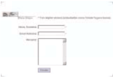
Aynı form sayfasını bu sefer bir PC'de ve yine Explorer'da görüntülediğimizde, formdaki yazı alanları çok daha dar bir şekilde karşımıza çıkıyor, 'Gönder' butonu da farklı görünüyor.

1) Dreamveawer'da yeni bir sayfa açın, dil kodlamasını ISO Latin 5 windows-1254 olarak değiştirin.