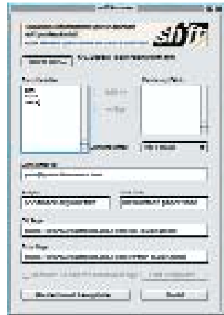
Yukarıdaki resimde InPHormer'ın basit ve kullanışlı arayüzünü görüyorsunuz.

Sıra geldi şapkadaki tavşan çıkartmaya! InPHormer'ı çift tıklayıp açın.